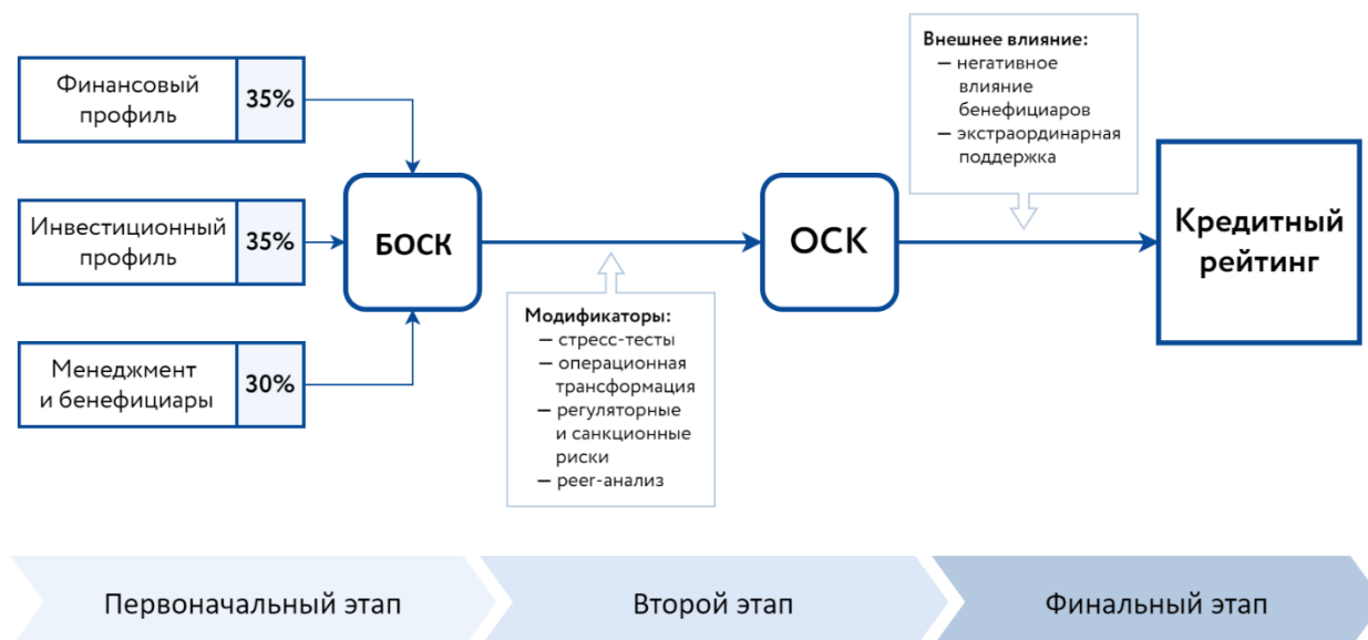
Рисунок 1. Алгоритм присвоения кредитного рейтинга для холдинговых компаний

На первоначальном этапе рейтингового анализа определяется базовая оценка собственной кредитоспособности (далее – «БОСК») РЛ как средневзвешенное значение оценок следующих ключевых рейтинговых факторов: