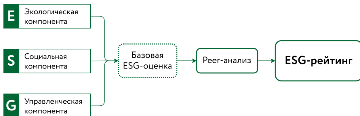
Рисунок 1. Алгоритм присвоения ESG-рейтинга

Алгоритм определения ESG-рейтинга включает следующие этапы: